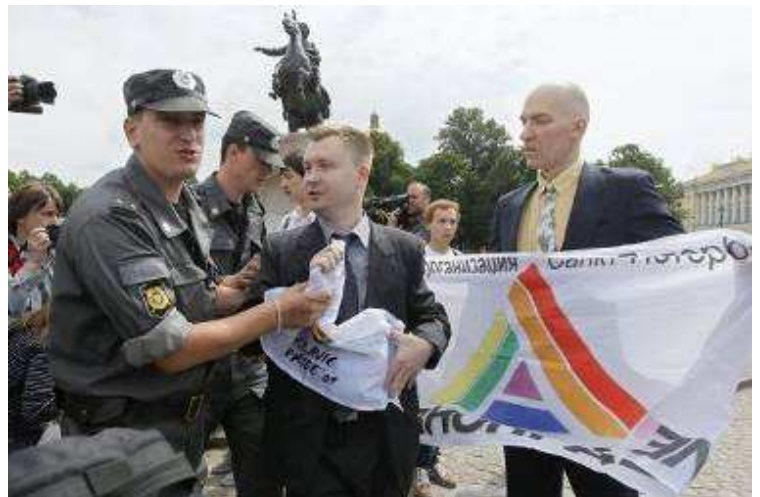
Attivisti per i diritti Lgbt arrestati a S. Pietroburgo

Diversi distretti hanno risposto proponendo sedi alternative non adatte all'evento, come boschi lontani e siti industriali e con motivazioni arbitrarie sul perché il Pride non potesse tenersi nell'area inizialmente proposta. Per esempio, l'amministrazione del distretto Vasileostrovskii ha informato il Ravnopravie che il percorso proposto, lungo le rive del fiume Neva, avrebbe distratto gli automobilisti nel traffico e, quindi, avrebbe potuto causare incidenti.