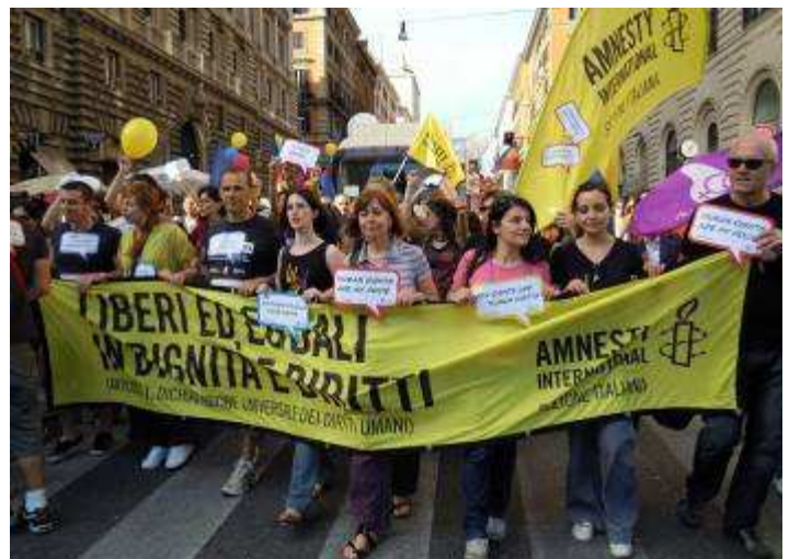
Amnesty all'Europride 2011

Perciò, in occasione dell' Europride 2011 a Roma, Amnesty International ha chiesto agli stati un impegno effettivo affinché le persone Lgbt non siano vittime di discriminazione nelle loro comunità, possano godere degli stessi diritti di ogni altro cittadino e possano esprimere liberamente e pacificamente la loro identità, sottolineando che l'orientamento sessuale e l'identità di genere, al pari dell'origine etnica, del genere o della nazionalità, fanno parte dei caratteri fondamentali dell'individuo.