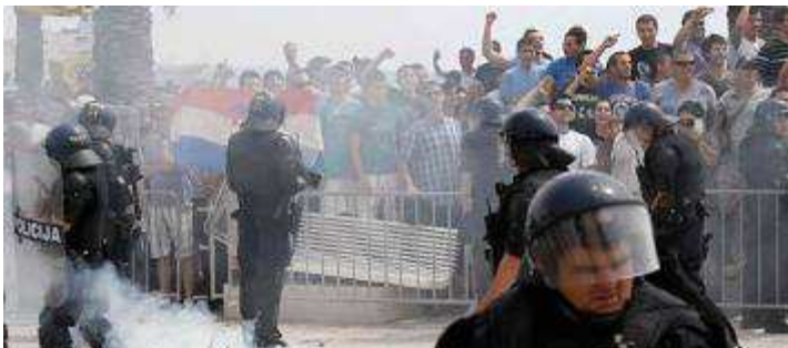
Disordini al Pride di Spalato

Amnesty International ha condannato gli atti di violenza verificatisi sabato 11 giugno a Spalato, causando l'interruzione della marcia del Gay Pride "Famiglie diverse, uguali diritti". Amnesty ha chiesto alle autorità di indagare immediatamente sugli incidenti e di portare di fronte alla giustizia i responsabili.