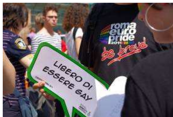
Amnesty all'Europride 2011

Per tanti è ancora difficile poter organizzare e svolgere un Pride in sicurezza; per altri è ancora vietato e per troppe persone è comunque impossibile vivere serenamente e in dignità, nel pieno rispetto della persona, il loro orientamento sessuale e l'identità di genere.