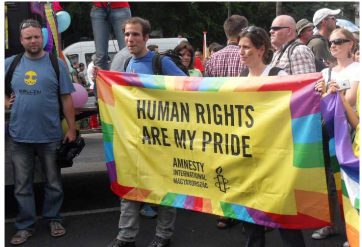
Amnesty International al Budapest Pride 2011

In passato, durante la marcia si erano già palesati piccoli gruppi contrari al Pride, ma, a partire dal 2007, il clima di omofobia e intolleranza ha subito un crescendo vertiginoso. I contromanifestanti durante la marcia del 2007, infatti, oltre a essere passati da poche decine ad alcune centinaia, hanno commesso azioni violente quali il lancio di uova, bottiglie e molotov, il tutto in presenza della polizia che però non è intervenuta per garantire la sicurezza dei partecipanti.