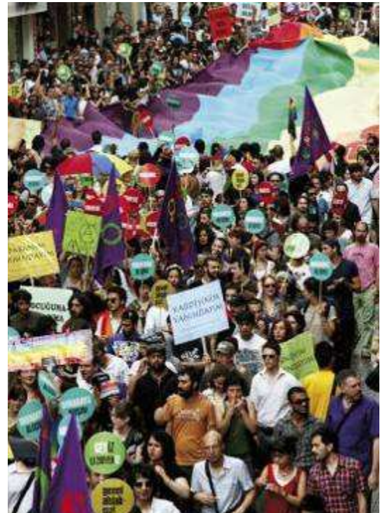
Gay Pride 2010 a Istanbul

“Impossibilitate a trovare un impiego, le persone transgender sono spesso costrette a svolgere prestazioni sessuali illegali, nel cui ambito vengono ulteriormente perseguitate da pubblici ufficiali. Sono inoltre il bersaglio preferito dei crimini dell’odio, ma questo aspetto rimane largamente ignorato da parte delle autorità” – ha aggiunto Gardner.