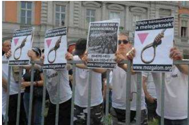
Contromanifestanti al Budapest Pride 2011

Nonostante la manifestazione, che ha coinvolto circa 2000 persone, si sia svolta in un clima festoso, con la presenza di musica, tre carri, bandiere e palloncini colorati, e si sia conclusa altrettanto tranquillamente in riva al Danubio con una serie di interventi applauditissimi, è stato ugualmente possibile percepire la