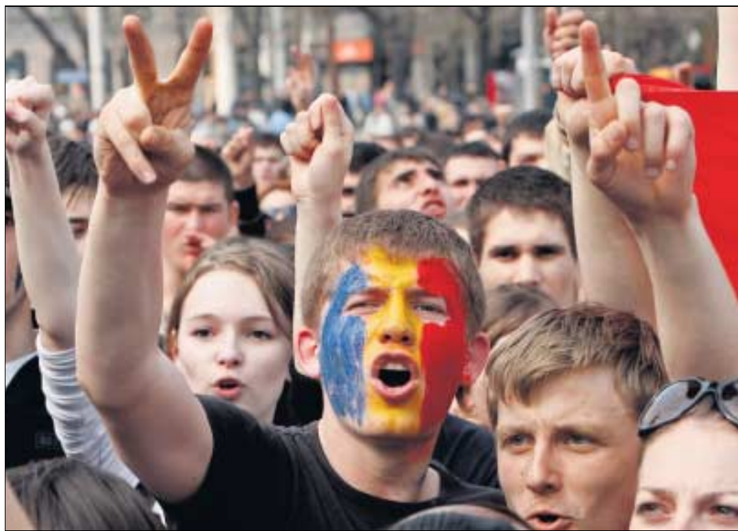
Junge Demonstranten protestieren gegen den Wahlsieg der Kommunisten in Chisinau.

Zwischen diesen beiden Bevölkerungssegmenten fehlt in wesentlichem Ausmass und sehr fühlbar das Bindeglied der beruflich aktiven Generation im sogenannt besten Alter. Laut Schätzungen verdienen nämlich ein Viertel bis die Hälfte aller Berufstätigen ihr Auskommen als Gastarbeiter im Ausland, hauptsächlich im benachbarten Rumänien und in Südeuropa sowie in Russland. Das Geld, das sie zurück in die Heimat überweisen, ist für die Moldau lebenswichtig. Es belief sich in der jüngsten Vergangenheit auf eine Summe, die ungefähr so gross war wie der Staatshaushalt und etwa 40 Prozent zum Bruttoinlandsprodukt beitrug. Nun indessen gehören die Gast-