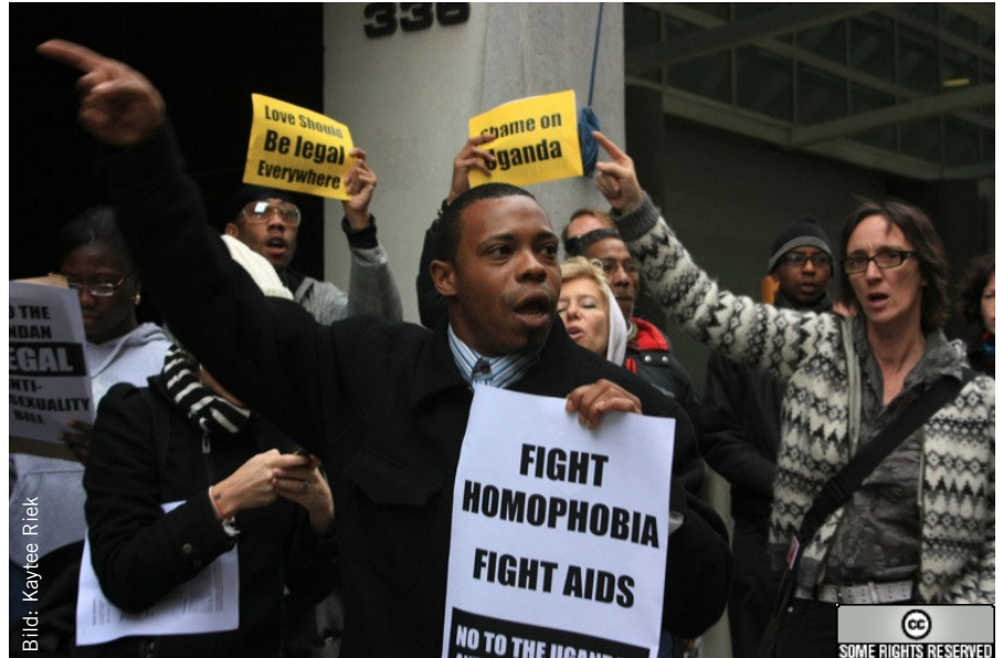
Aktivist_innen protestieren gegen den Gesetzesentwurf

Du kannst dich für die Freilassung der beiden Männer in Malawi einsetzen, indem du den Appellbrief auf der letzten Seite unterschreibst und an die zuständigen Behörden in Malawi schickst.